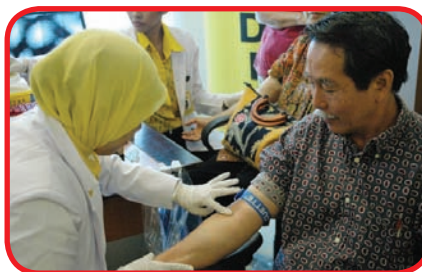
Pemeriksaan kolesterol secara gratis.