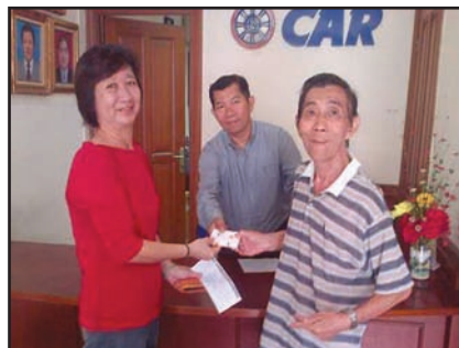
L@NCAR Jakarta - Duta Merlin