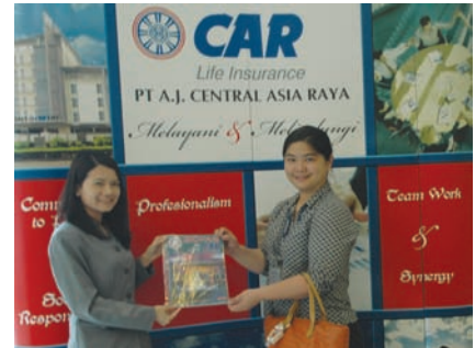
L@NCAR Pusat - Jakarta