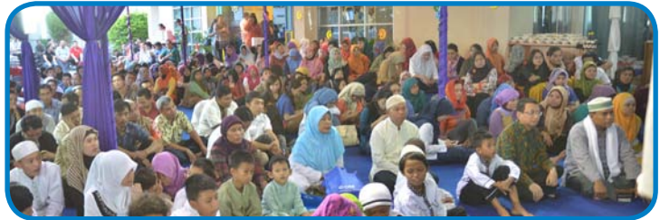
Suasana Buka Puasa Bersama Keluarga Besar PT A.J. Central Asia Raya

Diharapkan melalui kegiatan ini dapat semakin memupuk rasa kebersamaan dan kepedulian di keluarga besar PT A.J. Central Asia Raya. ❁