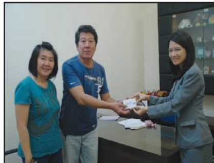
L@NCAR Pusat - Jakarta