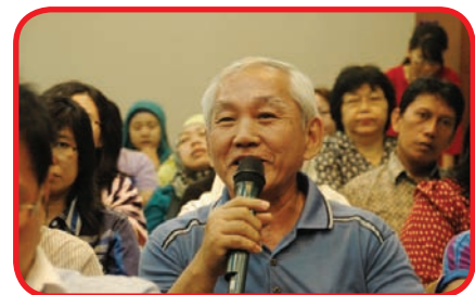
Antusiasme nasabah dalam sesi tanya jawab seputar kesehatan jantung.