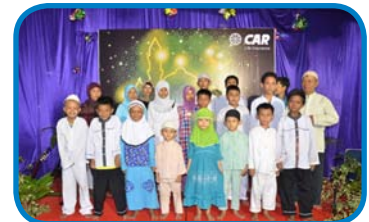
Pemberian donasi kepada Yayasan Yatim Al-Ainun