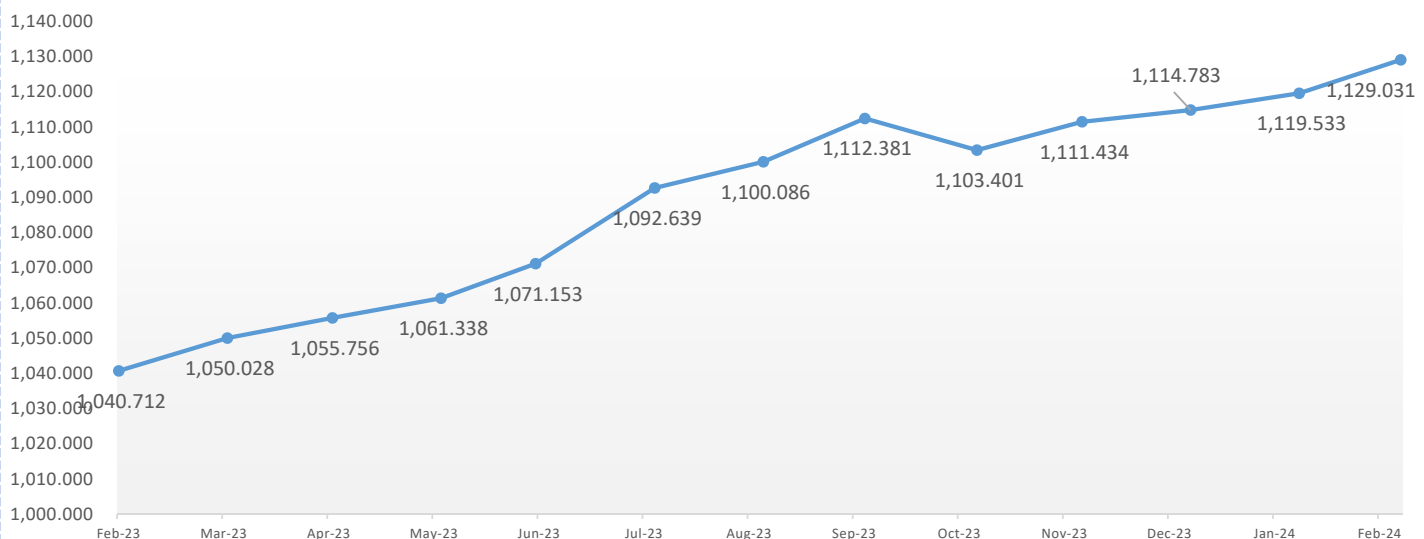
Pergerakan NAV New CARLink Pro Mixed 1 Tahun Terakhir